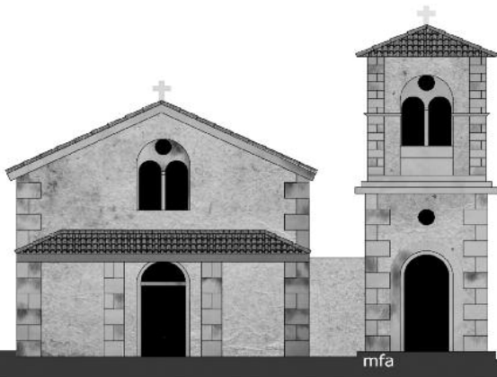
Η δυτική πλευρά-είσοδος με το καμπαναριό

Η όψη της οριστικοποιημένης μελέτης φαίνεται στο παρακάτω σχέδιο.