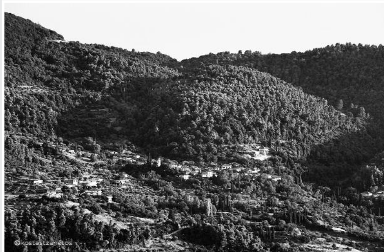
Το χωριό Σκλήβα

Τον καιρό που ήταν επικηρυγμένος ο Κοντοβουνήσιος και τον καταδιώκανε τα αποσπάσματα, είχε καταφύγει και κρυβόταν μόνος σε ένα ερημικό μέρος κάτω από την Πανα-