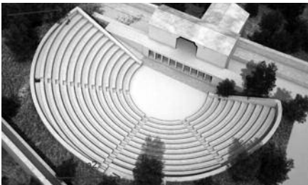
Το αρχαίο θέατρο όπως το μελέτησε η κ. Μαγνήσαλη

Ανακούφιση και μεγάλη χαρά νιώσαμε όταν λάβαμε την παρακάτω επιστολή από τη μελετήτρια του Αρχαίου Θεάτρου Πλατιάνας κ. Μαρία Μαγνήσαλη .