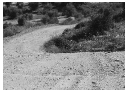
Ο σημερινός δρόμος προς Αρτέμιδα-Μάκιστο

Παραθέτουμε παρακάτω το Β.Δ. αυτό όπου ο συγκεκριμένος δρό-